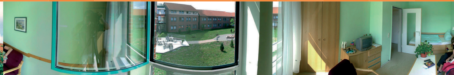
Lage und Klima